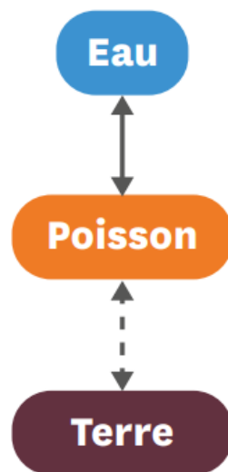
D.O.I. du poisson

Interaction : avec la Terre et avec l'eau