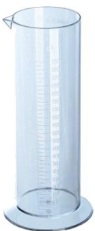
Utiliser une éprouvette graduée