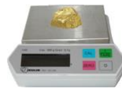
Mesurer la masse de la pépite