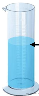
La remplir de liquide Lecture volume V 1