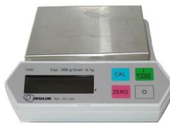
Tarer la balance il doit s'afficher 0.00 g