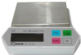
Mettre la balance sur ON