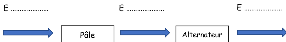
Diagramme énergétique :